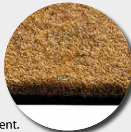
Semelle en caoutchouc recyclé

fibres de polypropylène aiguilletées sur semelle caoutchouc recyclé