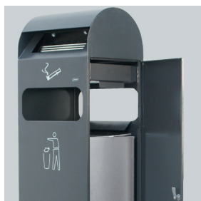
BAC INTÉRIEUR GALVANISÉ