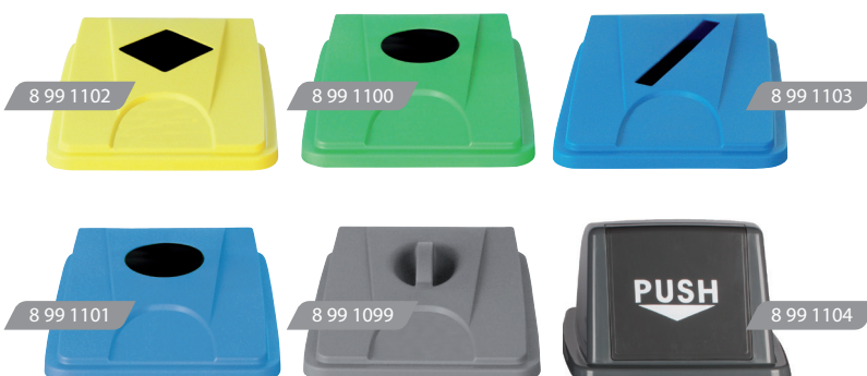
TYPE DE COUVERCLES DISPONIBLES POUR COLLECTEURS TRI SÉLECTIF 60 ET 80 L.