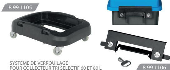
SYSTÈME DE VERROUILLAGE POUR COLLECTEUR TRI SÉLECTIF 60 ET 80 L