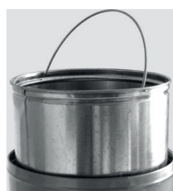
BAC INTÉRIEUR GALVANISÉ AVEC ANSE FOURNIE