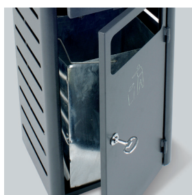
BAC INTÉRIEUR GALVANISÉ